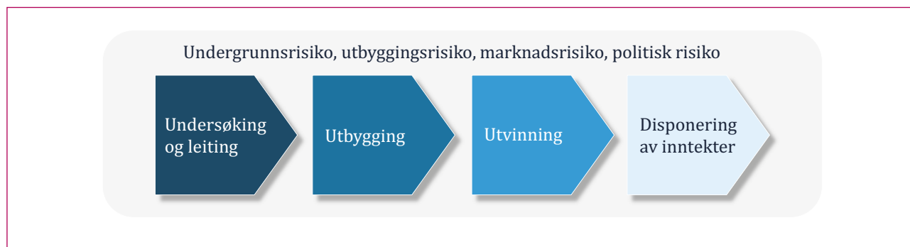
Figur 1: Forvaltning av naturressursar: Fire stadium, fire riskofaktorar

velferdsnivå på varig basis (Jfr. Figur 1). Dette kan kanskje høyrast enkelt ut i prinsippet, men i praksis er det i sanning ei komplisert øving, som føreset varsemd i regulering og rammevilkår, planlegging i utvikling og utbygging, samt edruskap i omgangen med inntektene frå utvinninga (van der Ploeg, 2011; van der Ploeg og Venables, 2011). På eit meir finkorna nivå omfattar forvaltning av olje- og gassressursar ei rekke område utforming av politikken spelar ei avgjerande rolle for utfall, inntektspotensial og risiko.